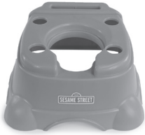
Base Unit Unidad de base