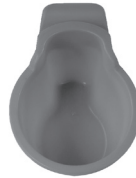
Waste Tub Recipiente de desechos